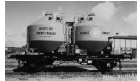
V6 - Ciments Français - Epoque III