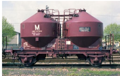
V5 - Transport de sable sec - Epoque IV