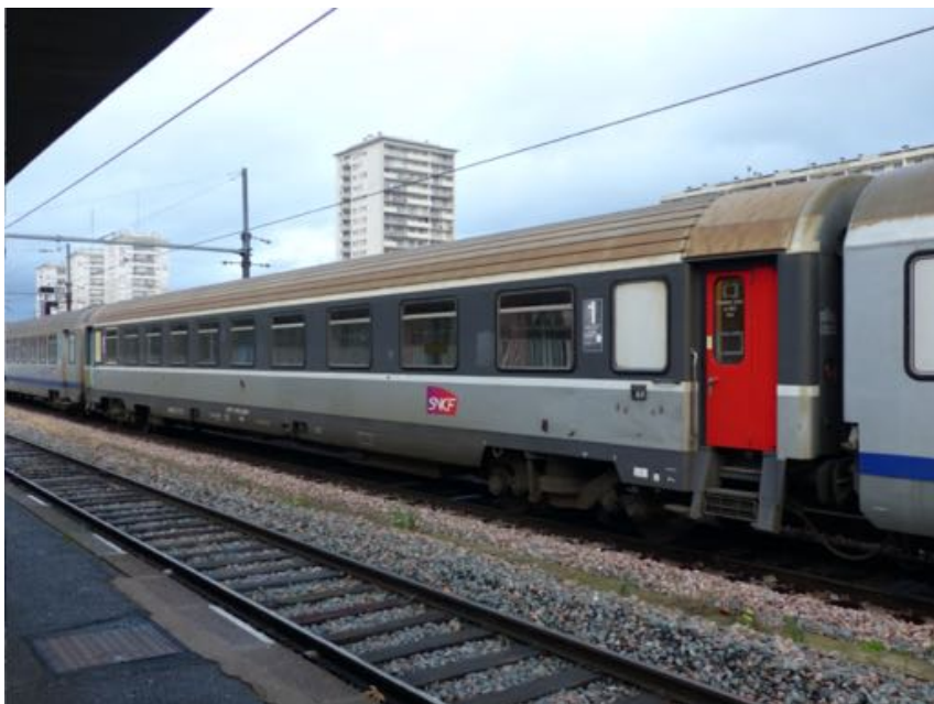
Voiture Corail VU mixte A4B6 en décoration époque V, logo carmillon, portes entièrement peintes (rouges en 1 ère , vertes en 2 ème )

- les voitures Corail , avec une finition inégalée et le strict respect des particularités et des différentes livrées, avec les VTU des deux classes ainsi que la voiture bar Corail, et les VU dont la mixte fourgon était présente partout, tout comme les voitures couchettes, sans oublier le fourgon MC76 dont de nombreux exemplaires ont été vendus en Suisse aux CFF et au BLS. Ce programme est important et s'il est validé, glissera vraisemblablement sur deux années.