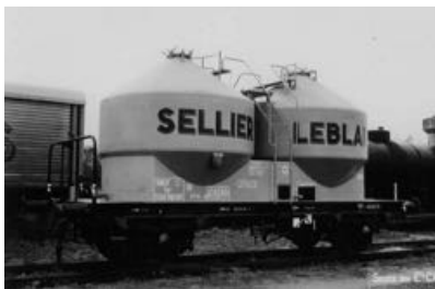
V7 - SELLIER LEBLANC - Epoque III