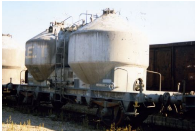
V1 - CET - Epoque IV