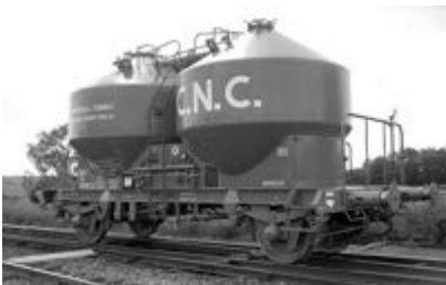
V10 - CNC - Epoque III