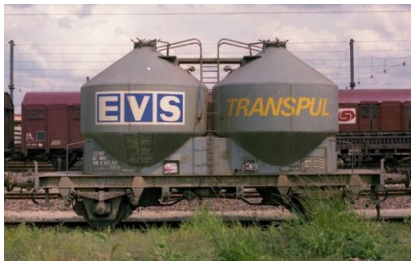
V4 - EVS Transpul - Epoque IV