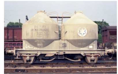
V12 - Ciments Français - Epoque IV