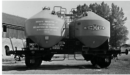
V11 - SIMOTRA sans p.f. - Epoque III