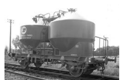
V9 - CNC/SMTS - Epoque III