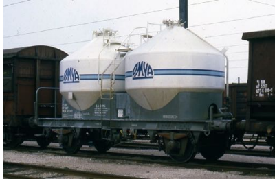
V2 - OMYA - Epoque IV