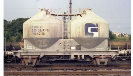
V3 Ciments Français - Epoque IV