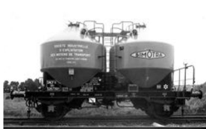
V8 - SIMOTRA - Epoque III