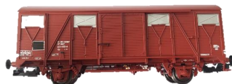
42245-06 : SNCF 87 121 3153-3