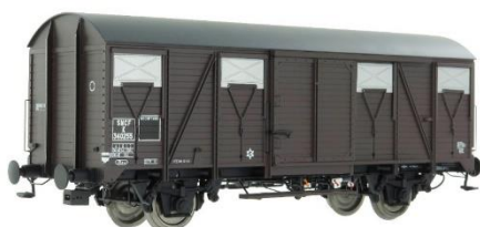
42245-04: SNCF K 340 689