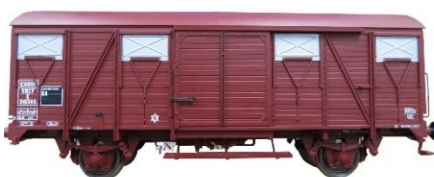
42245-05 : SNCF K 343 274