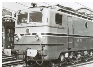
V1C CC 7121