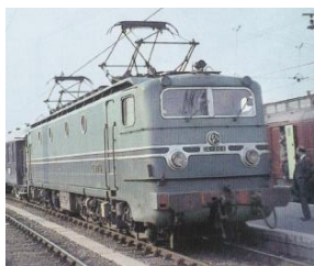
V1 B V1M