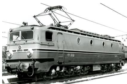
V1A V1C V1D V1E

Rappel sommaire des versions proposées (plaques MISTRAL prévues) Consulter également le site internet.