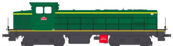
040DE 624 Valenciennes Panneaux non insonorisés Type Origine Vert 306/ Jaune Bouton d'Or Traverses rouges Bogies Châssis noir

Ci-dessous quatre versions supplémentaires créées en fonction des enseignements que j'ai retirés de vos choix de souscriptions au 15 août.