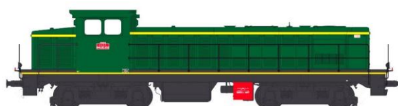
040DE 785 Villeneuve Panneaux insonorisés Type Origine Vert 306/ Jaune Bouton d'Or Traverses rouges Bogies Châssis noir